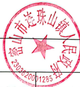
绩效运行监控表 (2022年度)