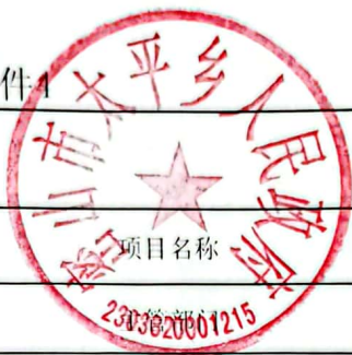
绩效目标自评表 (2022年度)