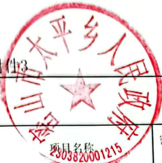
绩效运行监控表 (2022年度)