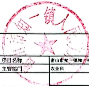
绩效运行监控表 (2022年度)